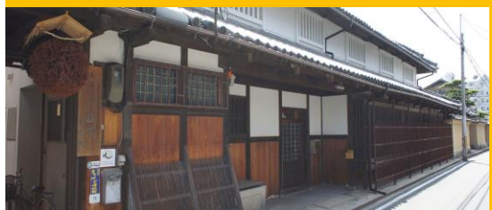
(匠の ippin 市場～商工会の中にあります)