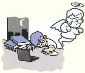
〈労働災害事故高額判決事例〉